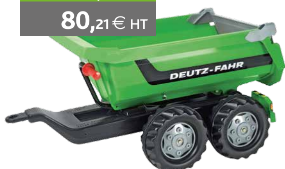
Remorque double essieu Age 3 ans et + Réf. K6-296