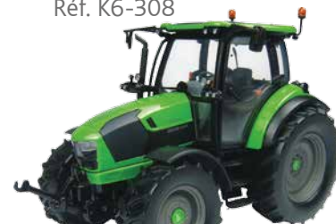
TTV 5130 Réf. K6-308