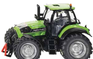
TTV 7230 Réf. K6-299