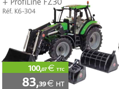
Agrotron 6180 + ProfilLine FZ30 Réf. K6-304