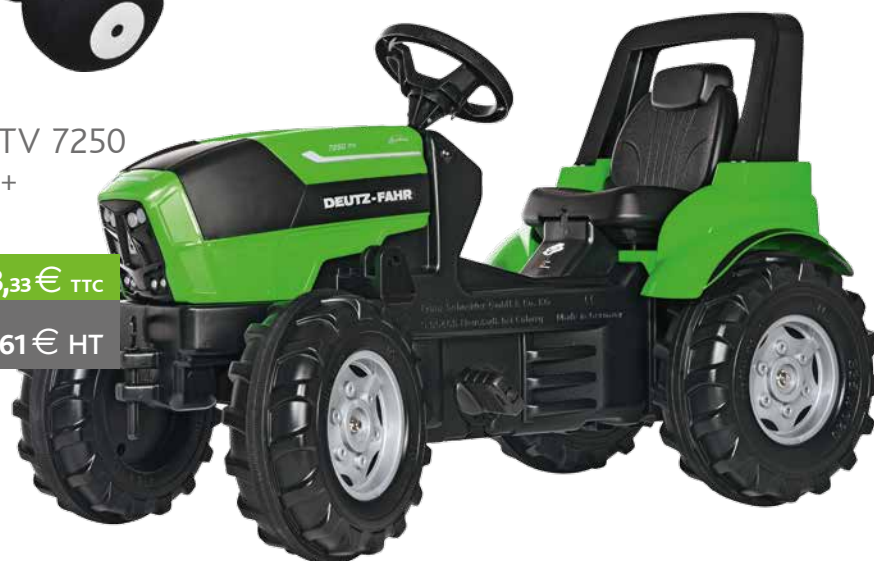
Tracteur TTV 7250 Age 3 ans et + Réf. K6-297