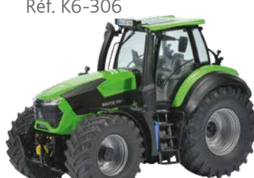
TTV 9340 Réf. K6-306