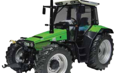
AgroStar 6.38 Réf. K6-302