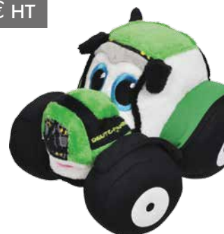
Peluche Réf. K6-300