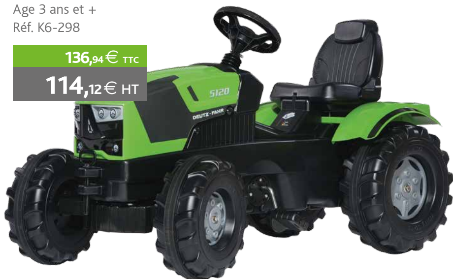
Tracteur 5120 Age 3 ans et + Réf. K6-298