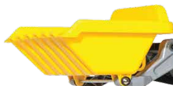
Tracteur Pelle + Remorque Age 2 ans 1/2 Réf. K6-295