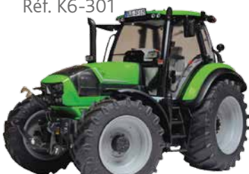
Agrotron 6190 Réf. K6-301