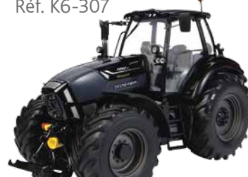
TTV WARRIOR 7250 Réf. K6-307