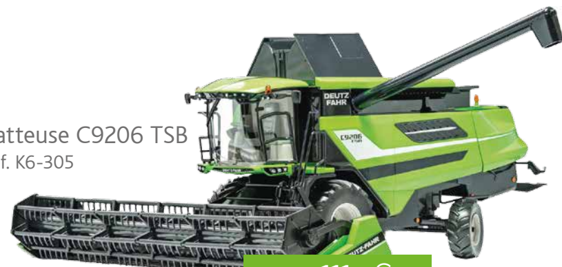
Batteuse C9206 TSB Réf. K6-305