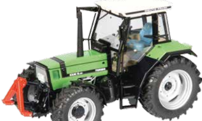
Agrostar DX 6.31 Réf. K6-303